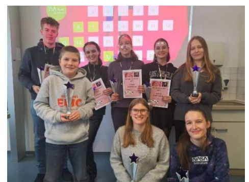
Die ausgezeichneten Sieger der Klassenstufen

Türchen öffnen im Advent kann jeder. Eine besondere Hausforderung nahmen 109 Schüler der Klassenstufen 6 – 12 an. Sie experimentierten und rätselten 24 Tage im Dezember an den Aufgaben des physikalischen Adventskalenders. Physik im Advent ist ein Wettbewerb u.a. der Deutschen Physikalischen Gesellschaft, der Georg-August-Universität Göttingen und der Wilhelm und Else Heraeus – Stiftung, an dem das MMG erstmalig teilnahm, mit hervorragenden Ergebnissen.