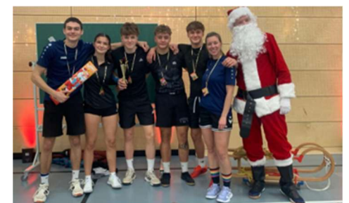
„Mein Lieblingsteam“ 2025